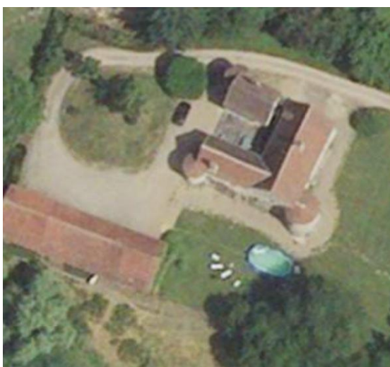
Château de la Berlière